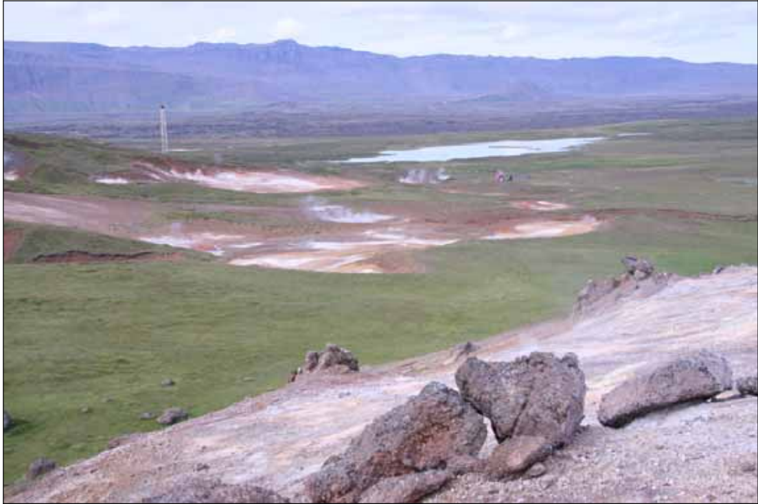
Mynd 2. Þeistareykir, horft til Lambafjalla. Tjörnin við Tjarnarás fyrir miðri mynd.